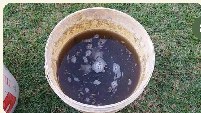
ADUBANDO COM HÚMUS