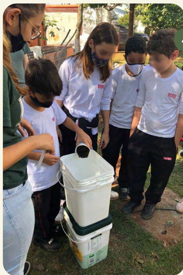
ADIÇÃO DOS RESÍDUOS